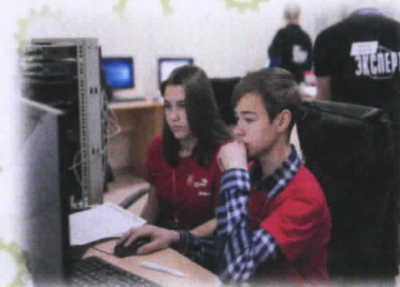
Программные решения для бизнеса