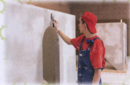
Сухое строительство и штукатурные работы